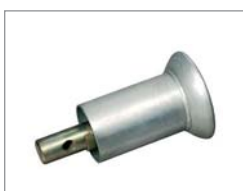
Monteringsrulle för slanglösa däck C4022287