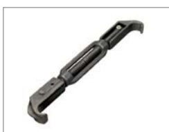
OTR-spännare för låsringsfälgar C4007611