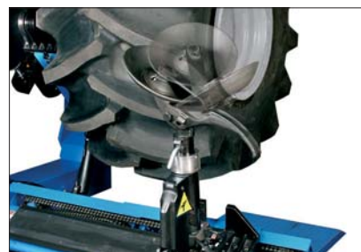
Monteringsverktyget kan roteras i 180 grader oberoende av armens läge.

Detta kraftpaket kan användas för däckmontering på fälgar från 4" till 58" ytterdiameter.