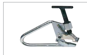
Clinchving för stålfälgar