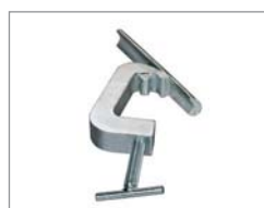
Glidande tving C4003269