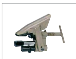
Clinchving för alufälgar C4021852